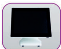
Pantalla 15" True-Flat Capacitiva

La fusión perfecta: calidad, innovación y estilo