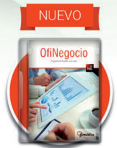
OfiNegocio Comercio Cloud

Apuesta a seguro. Somos tus Socios de Negocio.