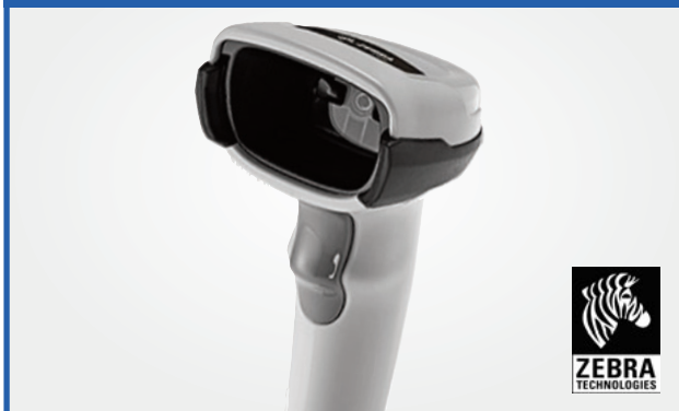
Scanner 1D/2D de mano con y sin cable DS2200 Series

BlueStar le presenta sus ofertas más recientes en Soluciones P.O.S.