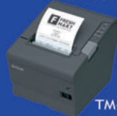
TM-T88VI Hasta 350mm/s