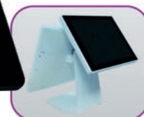
Display trasero opcional