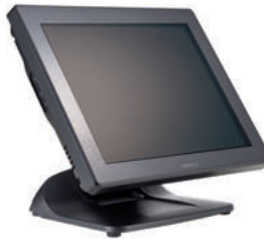
XT-5315 Procesadores i3