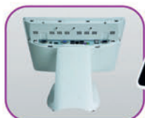
Conexión fácil y cables ocultos