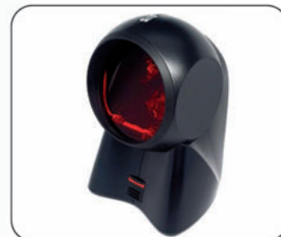
Escáner omnidireccional ORBIT