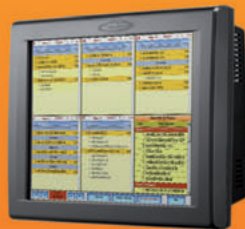
MONITOR DE COCINA