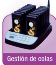
Gestión de colas