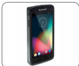
Terminal ScanPal EDA50