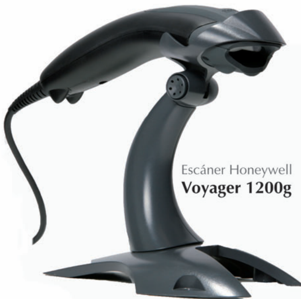
Escáner Honeywell Voyager 1200g