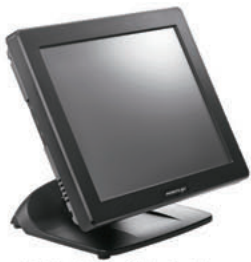
PS-3315E & PS-3316E (16:9)

Panel táctil tipo Flat sin bordes (opcional)