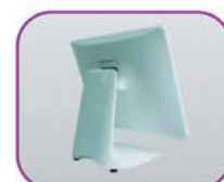
Rápida instalación y fácil mantenimiento