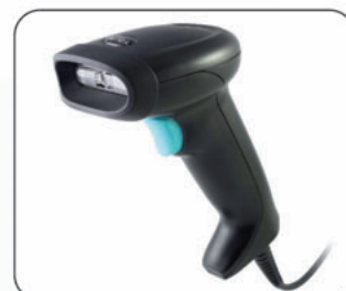
Escáner YouJie HH360